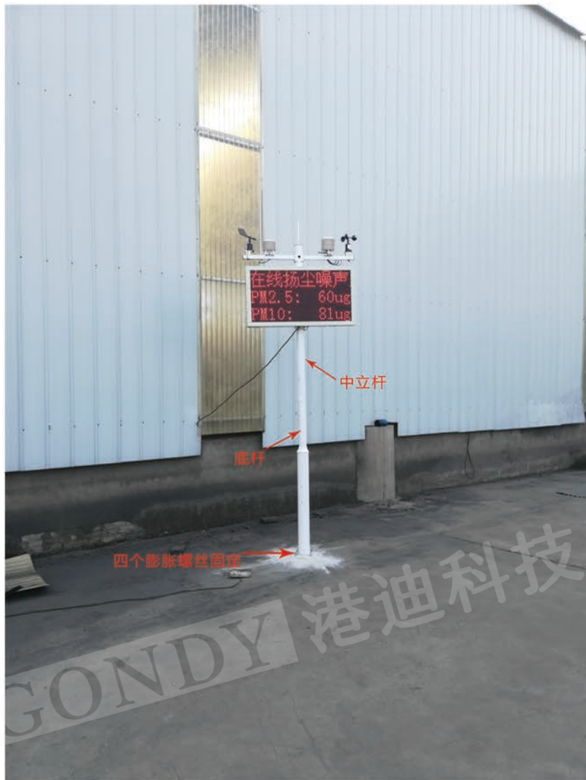
10、 安装完毕，通电测试。