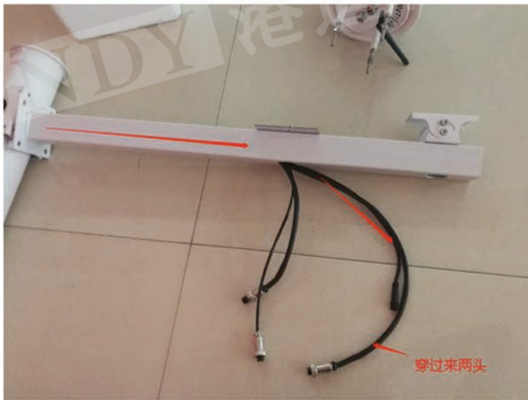
屏幕连接线穿入如图所示